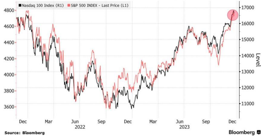
Nasdaq 100, S&P 500 Pull Back From Highs

اتجهت الأسهم الآسيوية للانخفاض الخميس بعد توقف سوق الأسهم العالمية عن الارتفاع، حتى مع ارتفاع سوق السندات في ظل توقعات بانخفاض أسعار الفائدة؛ حيث سجلت العقود الآجلة للأسهم في بورصات اليابان وأستراليا وهونج كونج خسائر، مما يعكس ضغوط البيع في بورصة نيويورك والتي دفعت مؤشر ستاندرد آند بورز 500 للانخفاض بنسبة 1.5%. وانخفض مؤشر ناسداك 100 بنفس النسبة، ماحيا المكاسب التي حققها في وقت سابق من الجلسة والتي كانت قد دفعته في البداية إلى مستوى قياسي خلال اليوم.